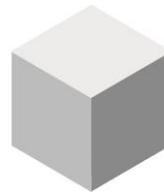
Silber (750 EUR)